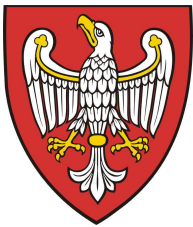
Urząd Marszałkowski Województwa Wielkopolskiego